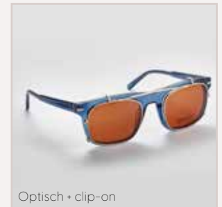
Optisch + clip-on